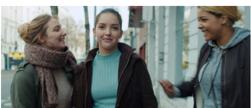
Court métrage de fiction : « Avaler des couleuvres »